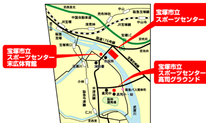
<宝塚市立スポーツセンター・宝塚市立末広体育館>